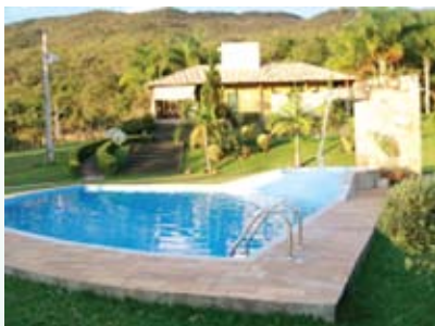
Pousada Cachoeira da Serra

de 58 hectares e oferece aos hóspedes caminhadas por trilhas, banho de cachoeiras e nascentes, mata nativa, piscina com aquecimento solar, sauna a vapor, restaurante de cardápio variado, além do circuito paisagístico planejado para o conforto e descanso dos visitantes.